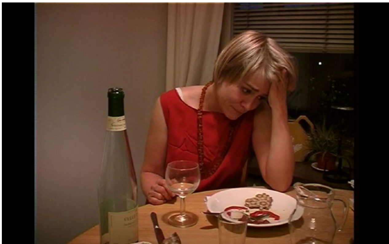
JANNICKE LÅKER, still image from 9 ½ minutes, 2000, image courtesy of the artist.

enskild person. Ingen annan bär skulden för ditt eget misslyckande än du.